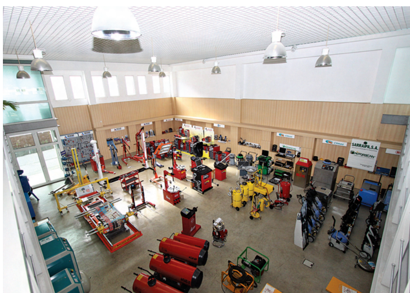
A Sarraipa possui um enorme espaço de exposição dos seus equipamentos para o sector automóvel, para além...