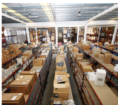
... de um enorme armazém para dar resposta rápida aos clientes e ainda um departamento técnico

sivas” da empresa para o mercado português, com destaque para a Motorscan (equipamentos de diagnóstico), Fergasa (cabines de pintura), Termomeccanica (bancos de ensaio), Focus Cemb (pneus), Cascos (elevadores), entre outras.